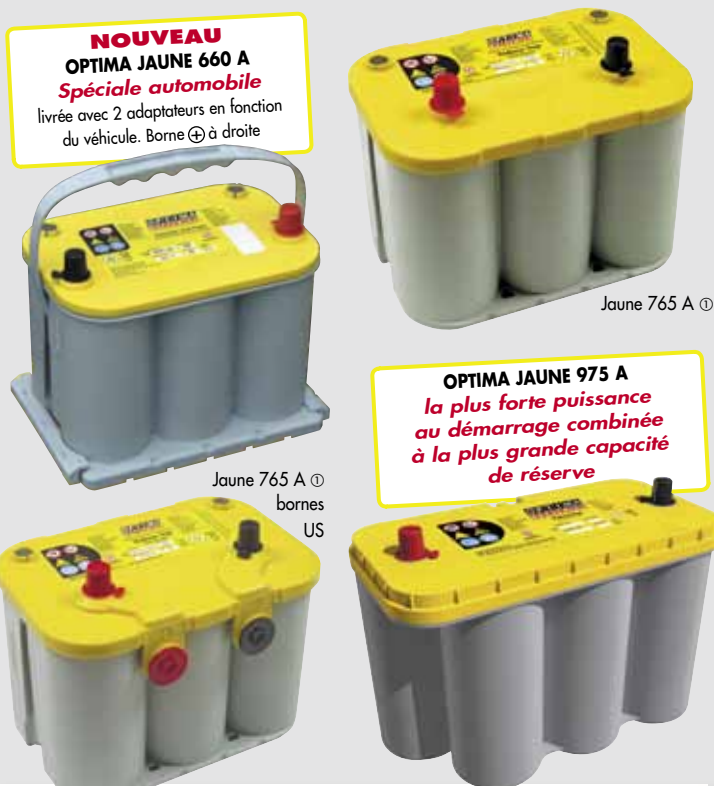
Jaune 765 A ①

livrée avec 2 adaptateurs en fonction du véhicule. Borne ⊕ à droite