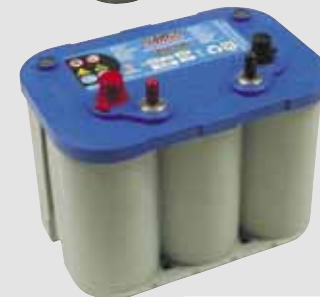
Bleue 765 A ①

① modèle passant de 690 A à 765 A (modification des valeurs sur les étiquettes courant 2005).