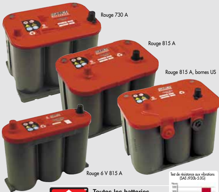
Rouge 730 A