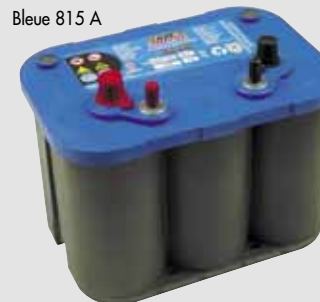
Bleue 815 A